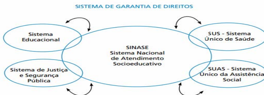
Gráfico 2 – Localização e articulação do Sinase com órgãos de defesa dos direitos das crianças e adolescentes

O gráfico 2 mostra a localização do Sinase e de algumas das relações mantidas no interior do Sistema de Garantia de Direitos: