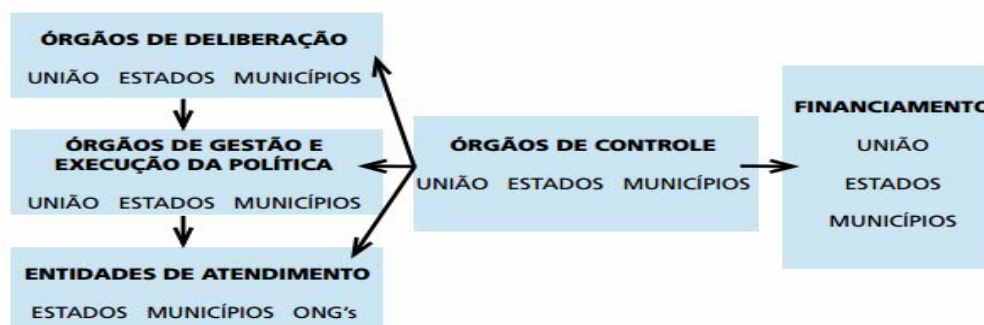
Gráfico 3 – Demonstrativo da Composição do Sinase - Detalhamento de competências, atribuições e recomendações aos órgãos do Sinase.

Em Goiás, do total de oito unidades, apenas três seguem o modelo preconizado por esse sistema que também compreende a competência, atribuições e recomendações de diversos órgãos, conforme o Gráfico 3.