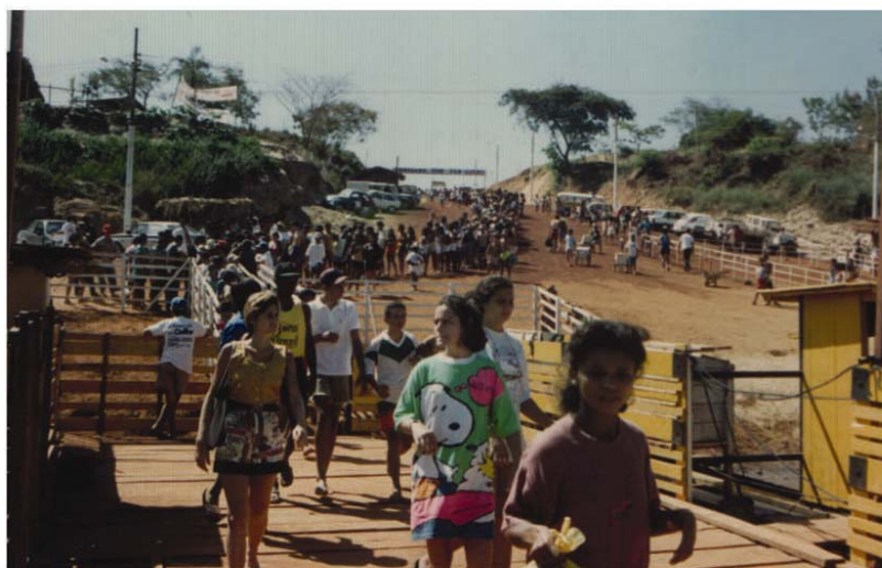
Foto 21 Travessia de barco para a antiga praia de Porto Real