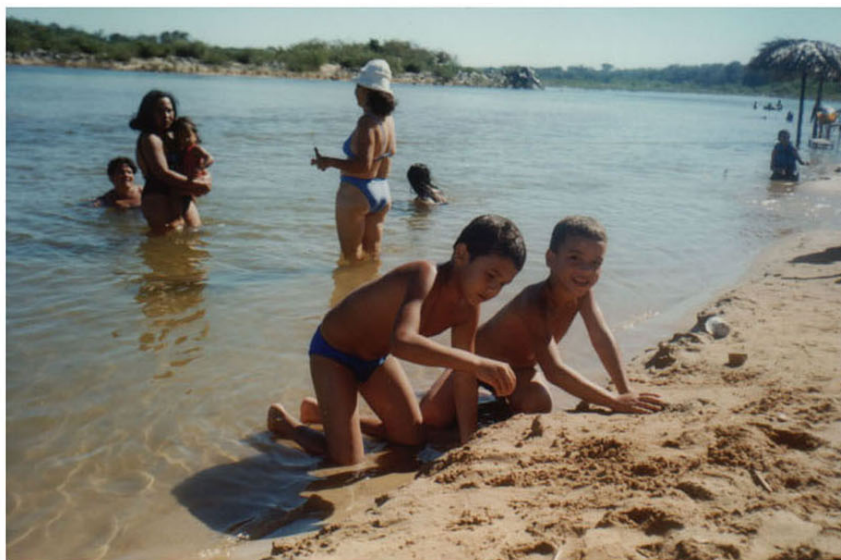
Foto: 15 b - Noeci Carvalho Antiga praia da Carreira Comprida -julho/1999