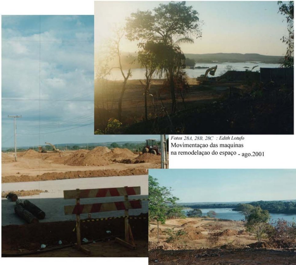
Fotos 28A, 28B, 28C : Edith Loufo Movimentação das maquinas na remodelação do espaço - ago.2001