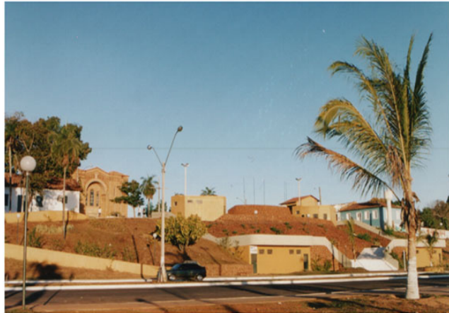
Foto 15 Vista da nova paisagem