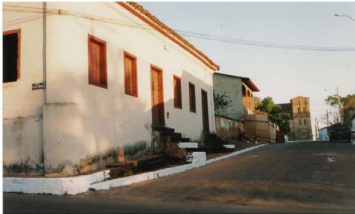
Foto 9 Em primeiro plano, casario; em segundo plano, casarios sendo reformados; ao fundo, Catedral. julho/2003