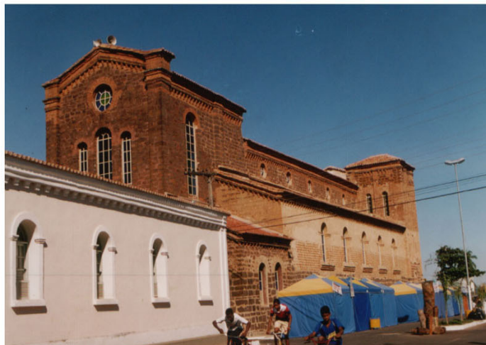
Foto 5 Vista da Catedral e Seminario São José e no entorno, barracas montadas na Semana da Cultura -julho/2003