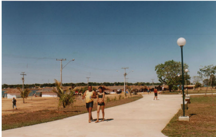
Fotos 31 e 32 - Vista da nova praia - julho/2003