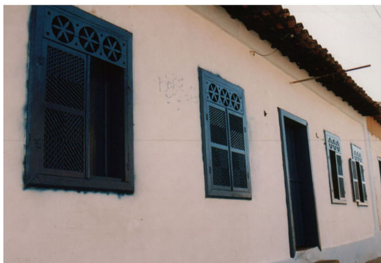
Foto 6 e 7 : Noeci Carvalho Casario do centro historico -julho/2003