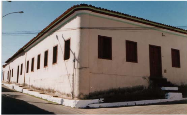
Fotos: 8 e 9 : Noeci Carvalho Casario do centro historico -julho/2003