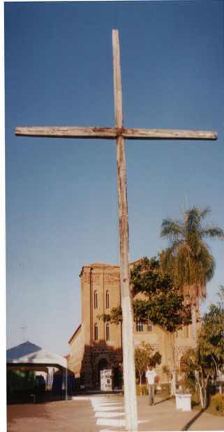
Foto 1 e 2: Noeci Carvalho Cruzeiro na praça da Catedral -julho/2003