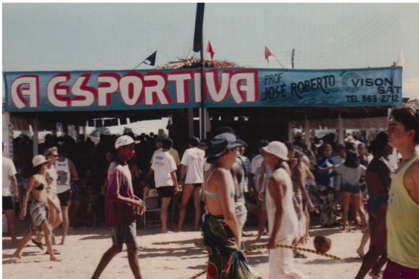
Foto 19 Barraca comercial na antiga praia de Porto Real