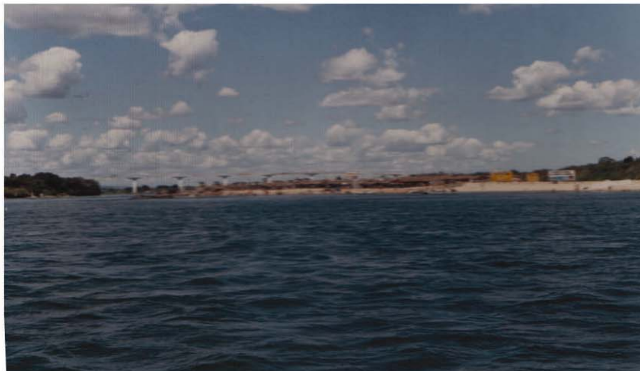
Fotos 16 e 17 : Jose Roberto Vista da antiga praia de Porto Real -198?