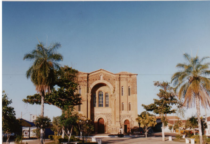
Foto 4 e 5 : Noeci Carvalho Praça da Catedral após a destruição do coreto -julho/2003