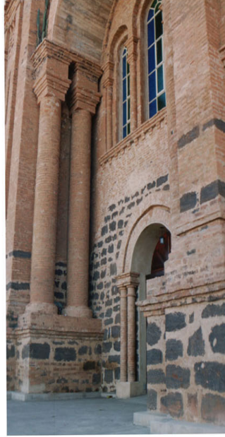
Foto 2 Detalhes da fachada da Catedral -julho/2003