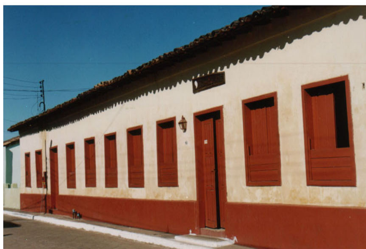
Foto 7 Antigo Colegio das Irmãs ( Caetanato), na rua do Cabaçaco. Hoje, predio da Comsaude -julho/2003