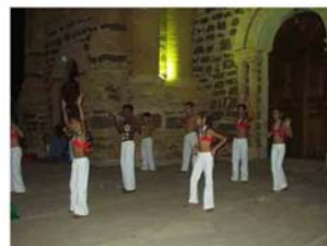
Apresentacoes na Semana da Cultura, julho de 2003