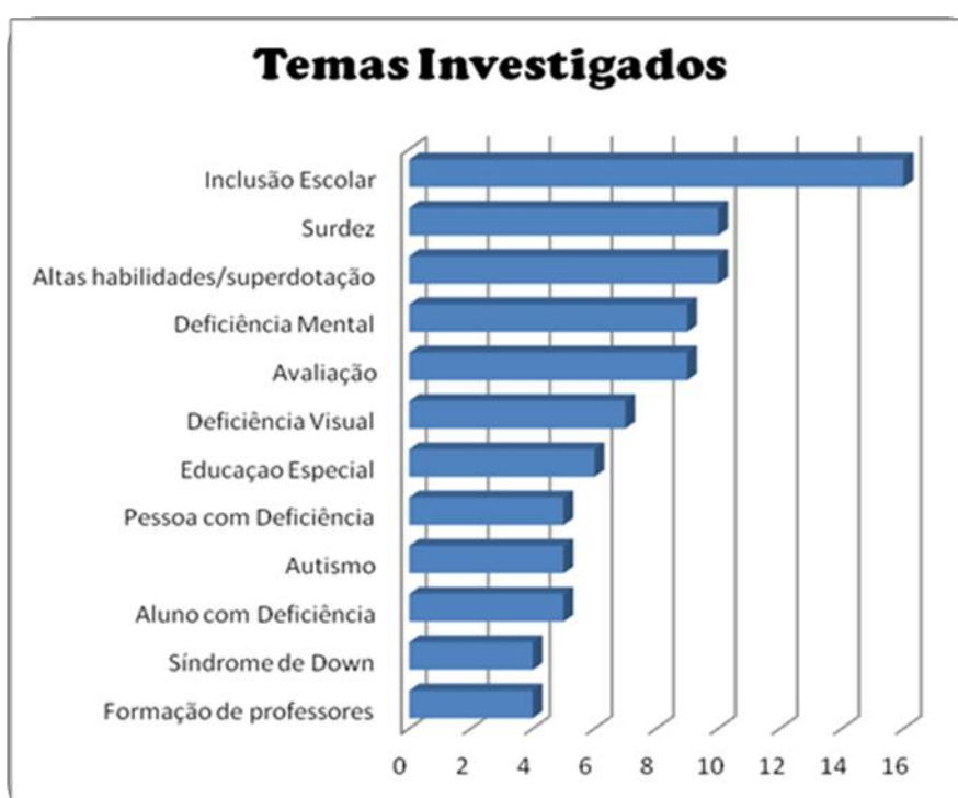
Gráfico 2 - Temas investigados