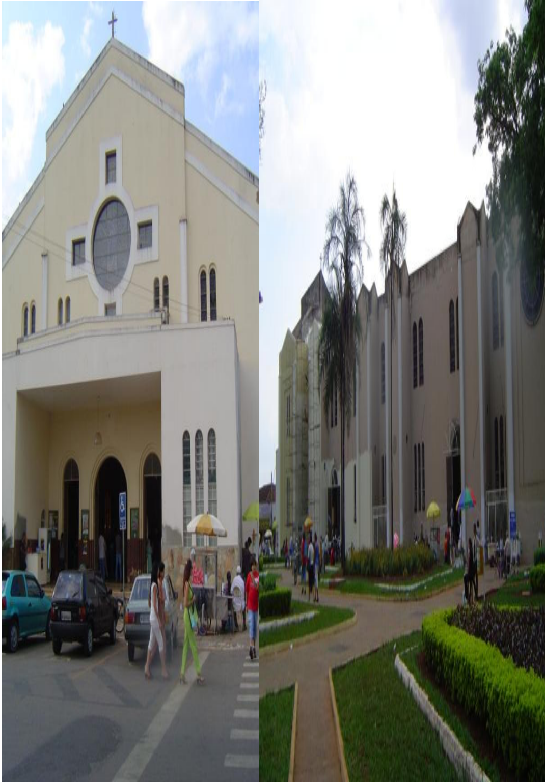
Fotos frontal e lateral da Igreja Matriz de Campinas