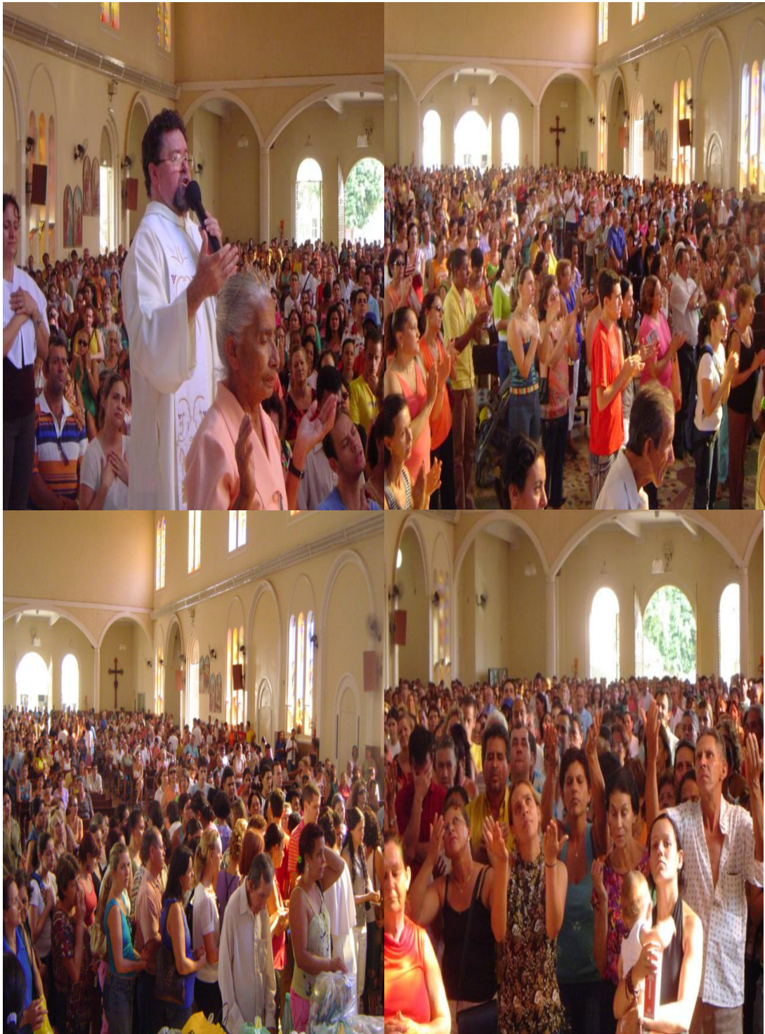
Fotos do rito realizado no dia 18/10/05 às 15 horas