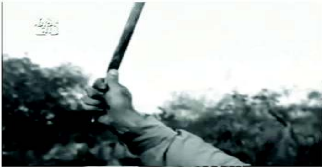
(Rocha, 1963/64, 1.08:35)

Chama, ainda, a atenção do leitor na cena destacada, o registro de uma voz ou de um pensamento: “A vida, muitas vezes, é quem governa a gente, meu bom pastor. Palavras somente não bastam para mudar a estrutura social”. Sem qualquer indicação do emissor por parte da voz narrativa, esse período deixa evidente uma crítica social a respeito das diferenças que imperam na estrutura da sociedade.