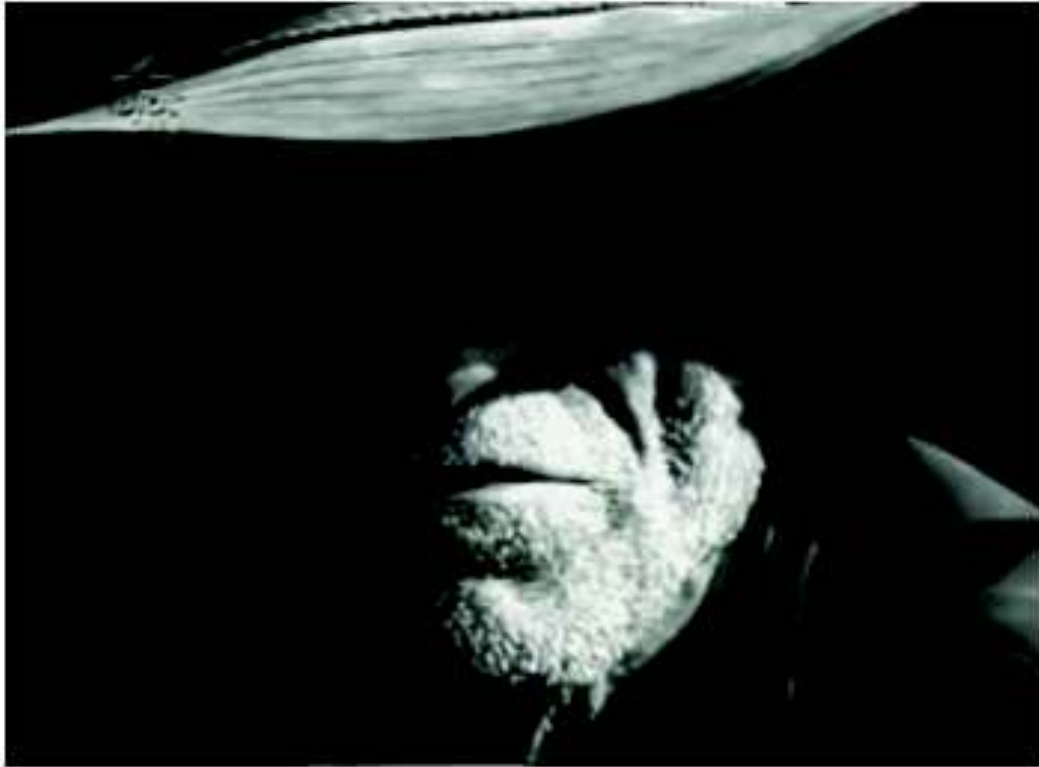
(Rocha, 1963/64, 00.26:25)

O filme de Glauber Rocha é povoado por uma quantidade sem par de participantes anônimos, sejam eles seguidores de santo Sebastião ou participantes do grupo de cangaceiros. São figurantes que trazem em seus rostos a expressividade do sertanejo sofrido, fanático, crédulo, explorado. Suas feições retratam o sentimento de desilusão frente a uma luta inglória diante das adversidades do destino. Por outro lado, representam a ingenuidade daqueles que surgem como massa de manobra de uma minoria injusta e inconsequente.