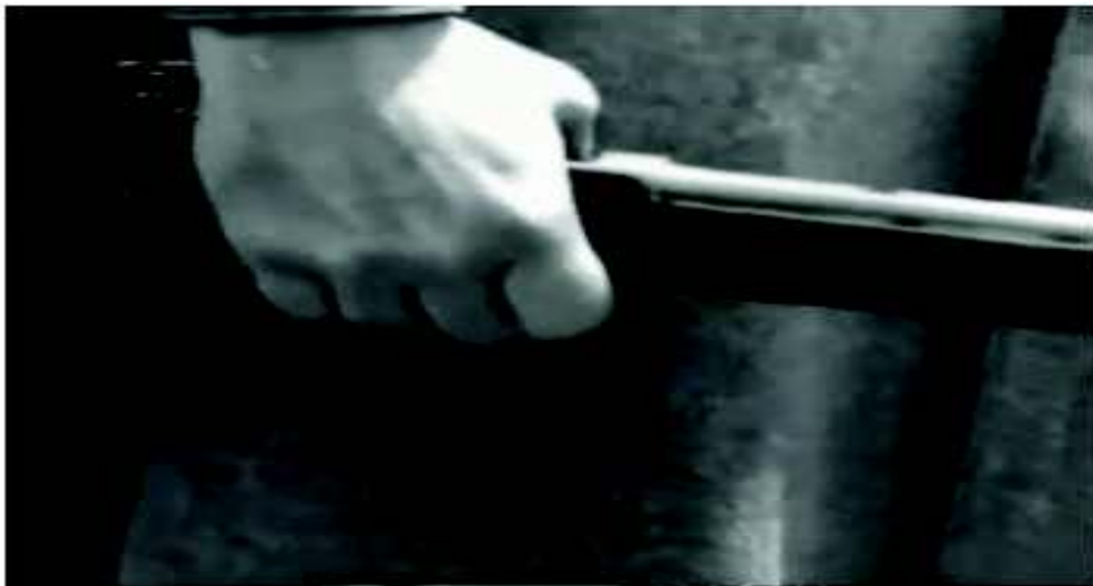
(ROCHA, 1963/64, 1.35:42)