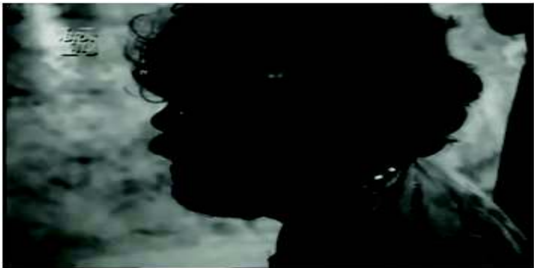
(Rocha, 1963/64, 00.52:30)

porém, vê seu rosto refletido naquele espelho natural tal qual Narciso e, contrariamente a ele, não aprova a imagem vista. O discurso indireto livre evidencia seu pensamento: “Tinha um sósia?” O sósia seria ela mesma. Seu orgulho, porém, não permite que se veja a si mesma desfigurada. Por isso, ao invés de projetar-se para a água, foge de fasto. O autor parece retomar o mito de Narciso às avessas e, ao leitor mais inclinado às letras da literatura universal torna-se impositiva a percepção da intertextualidade utilizada pelo autor.