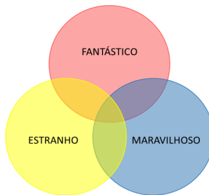
Figura 1 – (Representação gráfica elaborada pela autora)

Acredita-se ser oportuno demonstrar por meio da figura, a seguir, como essas categorias se relacionam, constituindo gêneros vizinhos, compondo, assim, o gênero Fantástico, segundo a tese de Todorov (2017):